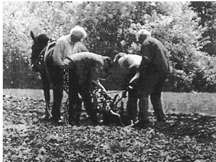
So hat's angefangen

Am 25.03.2018 in 49828 Osterwald Alte Piccardie 28